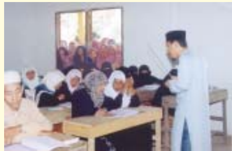
Ramai yang sanggup duduk ditepi-tepi tingkap dan pintu untuk mengikuti kursus kerana tidak cukup tempat