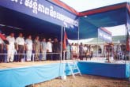
Mufti Kerajaan Kemboja dan Ketua Urusetia Kemboja bersama Pemimpin Negara dalam Perasmian Masjid di Kampong Cham