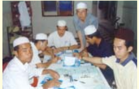
Penyemakan Perlaksanaan dan Penulisan nama-nama tempat Korban dan Aqiqah melalui sijil yang disahkan oleh imam-imam Masjid