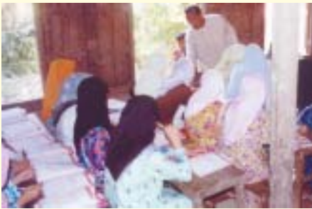
Para peserta boleh membaca Melayu Jawi tetapi menghadapi masalah dengan ejaan Rumi