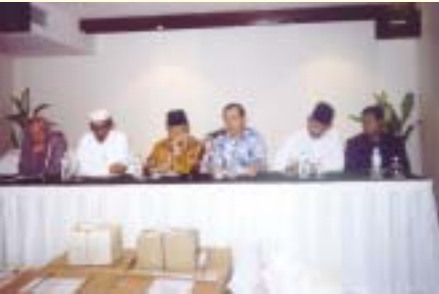
Bersama rombongan Mufti Kerajaan Negeri Johor dan Duta Malaysia di Phnom Penh