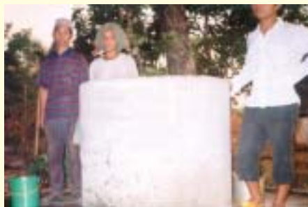
Sumbangan untuk pembinaan 4 telaga di Kampung Chnang