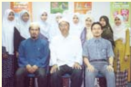
Urus Setia Malaysia