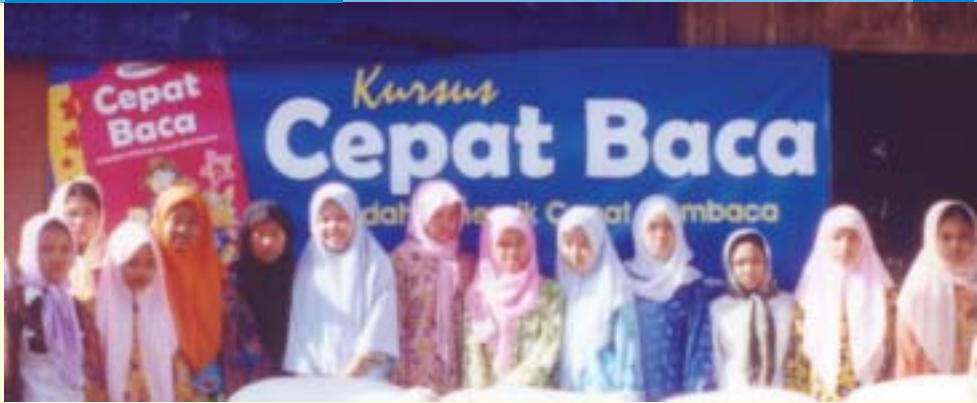
Kursus Cepat Baca di Madrasah An-Nikmah, Phnom Penh pada 14 Februari 2003