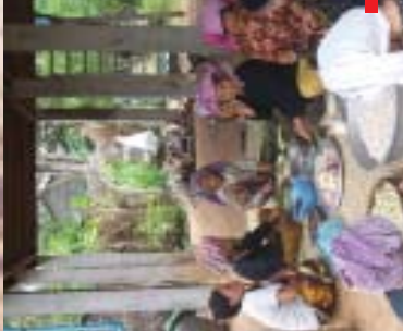
☑ Kaum ibu menyiapkan rempah ratus di bawah rumah