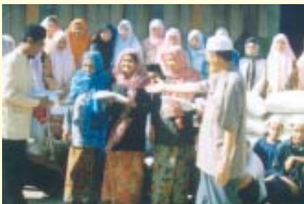
Sumbangan telekung dan beras 1000 kilogram