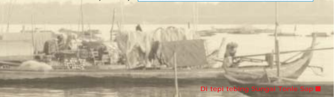
Di tepi tebing Sungai Tonle Sap