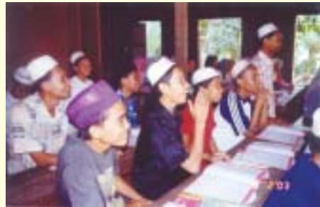
Pelajar Madrasah An-Nikmah gembira belajar Bahasa Melayu