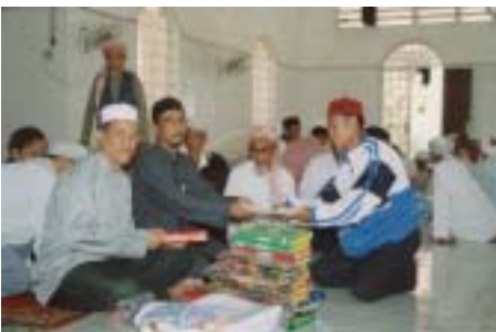
Sadaqah daripada peserta korban yang disampaikan oleh Mufti Kemboja.

“Kamu sekali-kali tidak akan mencapai (hakikat) kebajikan dan kebaktian (yang sempurna) sebelum kamu menderma sebahagian apa yang kamu sayangi.”