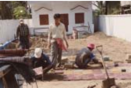
Dermawan Brunei, Malaysia dan Singapura serta titik peluh Umat Islam Kemboja untuk membina pejabat dan dewan Ilmu Mufti Kemboja.