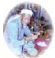
Bubur lambuk memang sedap.