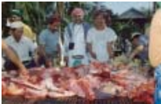
Gembira dengan barakah Allah s.w.t.