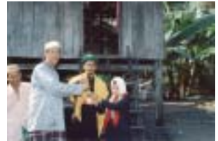
Sesungguhnya pahala sedekah itu sudah sampai kepada Allah sebelum sampai ke tangan orang yang menerima.