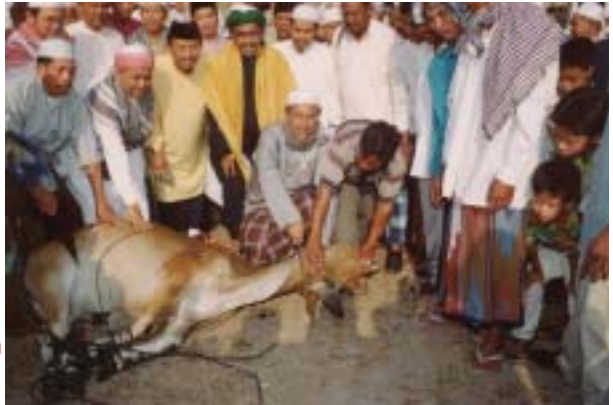
Pengerusi Program menunaikan amanahnya.