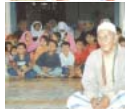
Kursus guru-guru di Phnom Penh