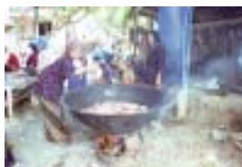
Kawah besar untuk jamuan berbuka