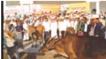
Sesungguhnya haiwan itu akan datang pada hari kiamat sebagai saksi.