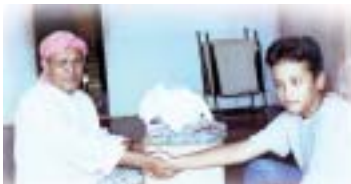
Hadiah daripada anak-anak Malaysia.