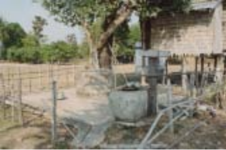
Musim kemarau berbulan-bulan, air paip tiada, hanya telaga untuk menyambung hidup. USD 100 untuk wakaf satu telaga.