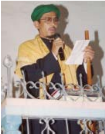
Khutbah Hari Raya Korban 1424H Di Masjid Al-Makmur, Chrorck Ramiet, Chhouk Sar, Kampung Tralach, Kg Chhnang, Kemboja.